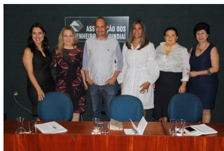
Ética na visão: jurídica, profissional, empresarial e social Apresentado na AEJ

Nossos sinceros agradecimentos aos apoiadores: AEJ (Associação dos Engenheiros de Jundiaí), ADEJ (Agência de Desenvolvimento de Jundiaí e Região), Escola Estadual Dom Joaquim Justino Carreira, Faculdade Anhanguera, FORCIS (Fórum Regional do Comércio, Indústria e Serviço), Mc Donald's (Loja de Jundiaí sorteou visita e degustação de produtos), GEFE (Grupo de Educação Fiscal do Estado – SeFaz), IBIS Hotel, SESI (Fiesp/Ciesp), SIEMENS Ltda., SPR, Grupo Mulheres do Brasil..