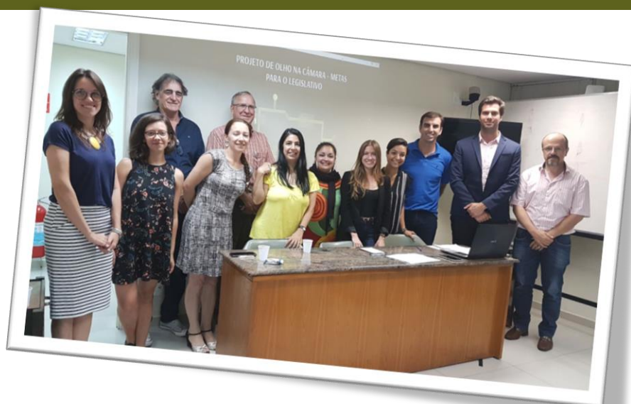
Apresentação do Projeto de Olho na Câmara – Metas para o Legislativo realizada no dia 13 de dezembro de 2017.

Acompanhamento das audiências públicas do Plano Plurianual (PPA) e da Lei Orçamentária Anual (LOA).