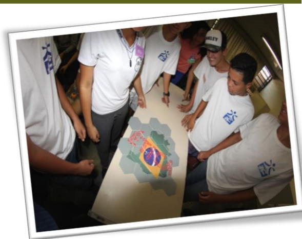
Atividade de Educação Fiscal realizada na EE Dom Joaquim Justino Carreira