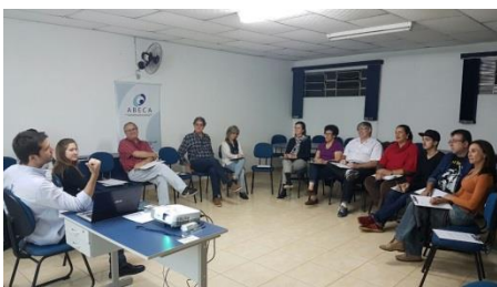
Capacitação de voluntários realizada na Abeca, em maio de 2017.